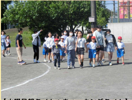
【水曜日朝タイム：ウォーキングタイム】

これからの暑さに負けないように。食事、睡眠、運動について、お子様と話をしてみてください。また、水曜日8：20～8：30のウォーキングタイムにつきましては、保護者のみなさん、下のお子さん も一緒に朝日を浴びながら歩きませんか？特に受付などはありませんので保護者証をつけてお越しください。