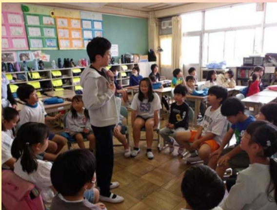
【ふれあいの日（たてわりグループ活動）】