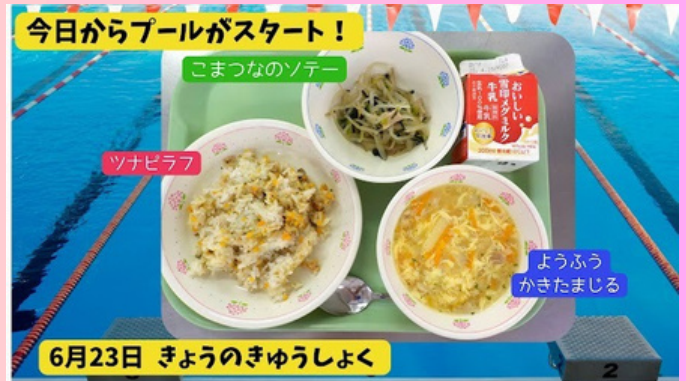
【毎日児童に提示している給食メニュー】